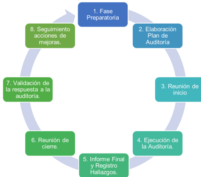
Figura: Etapas de las Auditorías de la Contraloría de la UC Temuco

El proceso de auditorías de la Contraloría, se encuentra documentado con la secuencia de cada una de sus actividades, registros y responsabilidades. Se adjunta en anexo, diagrama de flujo DFP-CONT 0001 Proceso Auditorías de Contraloría de la UC Temuco.